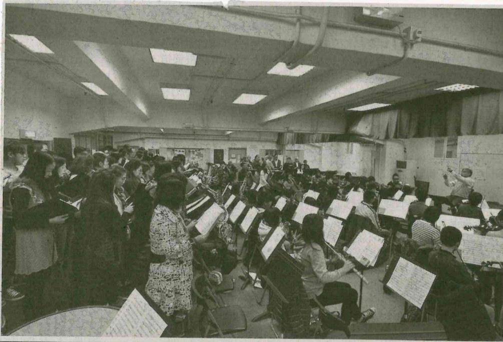
●聖庇護十世音樂學院合唱團、嚶鳴合唱團、聖多瑪斯合唱團及澳門青年交響樂團聯合演出綵排